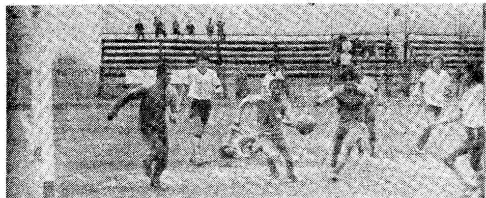
Faza care a precedat cel de-al doilea gol al echipei Minerul Vulcan din meciul cu Minerul Ghelari.