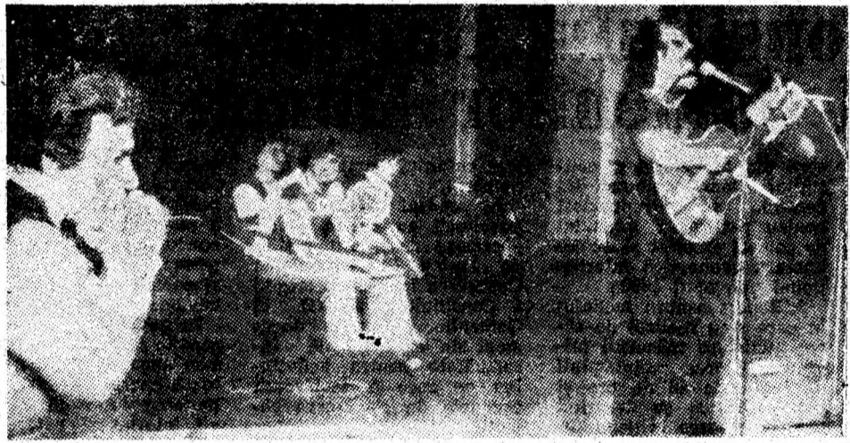
Cenaclul „Flacăra“, pe scena Casei de cultură din Petroșani.