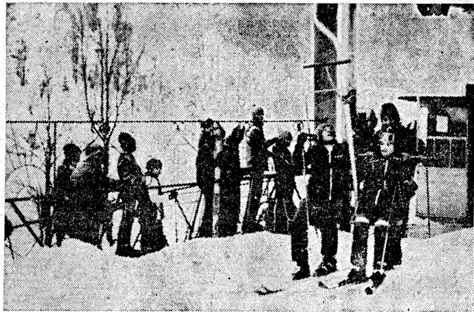
Schi alpin, campionatele naționale școlare