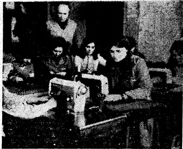
Instantaneu din atelierul școlii al cooperativei meșteșugărești „Straja” Lupeni, acolo unde se formează viitoarele cadre de meseriași.

Iată cum un colectiv dornic să se afirme printre colectivele fruntașe ale Văii, caută și găsește noi forme și mijloace de valorificare superioară a rezervelor de care dispune. Minerii de la Uricani sint conștienți că numai prin sporirea producției de cărbune, prin rentabilizarea întregii activități productive își vor îmbunătăți continuu nivelul lor de trai, își vor aduce o contribuție de seamă la independența energetică a țării.