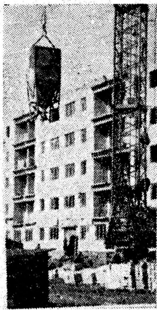
Instantaneu de muncă de pe șantierul construcțiilor de locuințe din orașul Lupeni.