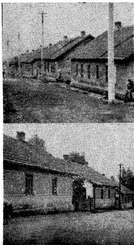
Răzlete imagini ale trecutului.