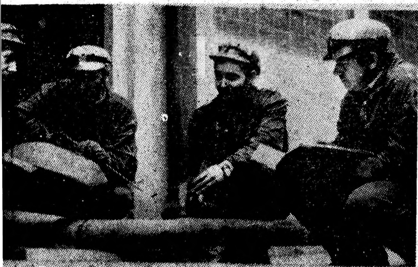
Se montează conducta de refulare a pompei „Lotru 2”.