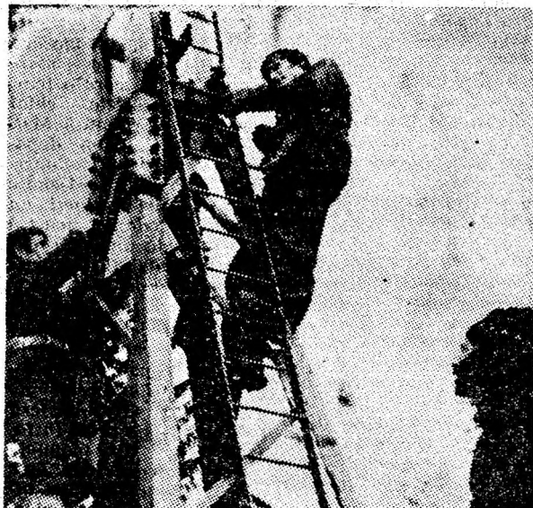
Telescaunul „Straja” Lupeni