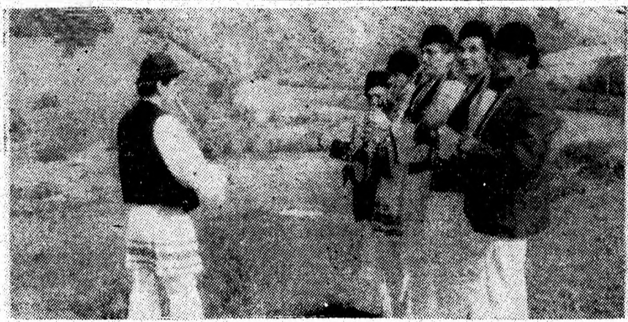
Fluierașii din Dealul Babii

te formații susțin spectacole arhipline, să auzi aplauze și îndemnuri din partea celor care îi cunosc pe artiștii amatori. Sau, la sfîrșitul acestuia an școlar, cînd școlile au găzduit emoționante programe artistice susținute de elevi. În săli, uneori pur și simplu în bănci, se aflau părinții acestor copii cărora le transpiraseră miinile pe flori, flori care aveau să răsplătească efortul depus pe scenă. Dar, în același timp, foarte neplăcut este să vezi sălile goale la spec-