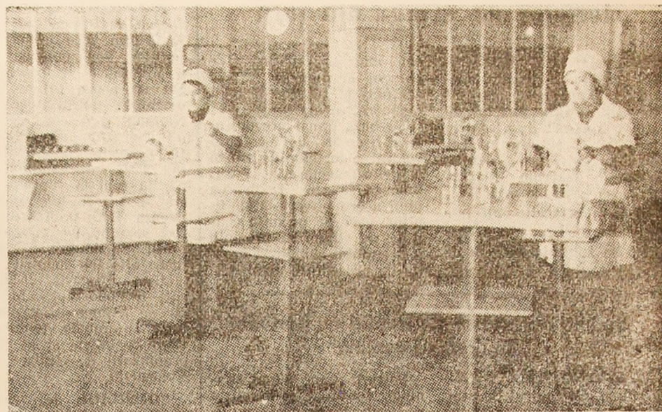
La cantina minerilor de la I.M. Lonea se pregătește sala pentru ca schimbul ce urmează a intra în mină să servească o masă gustoasă.