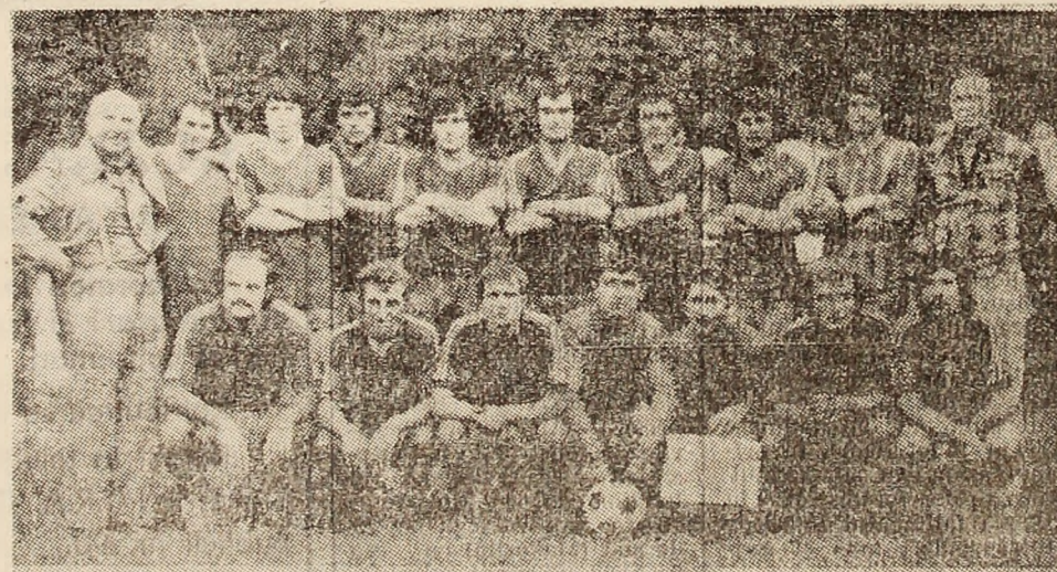
Echipa de fotbal „Minerul” din Aninoasa — campioana județeană de toamnă, proaspătă divizionară C.