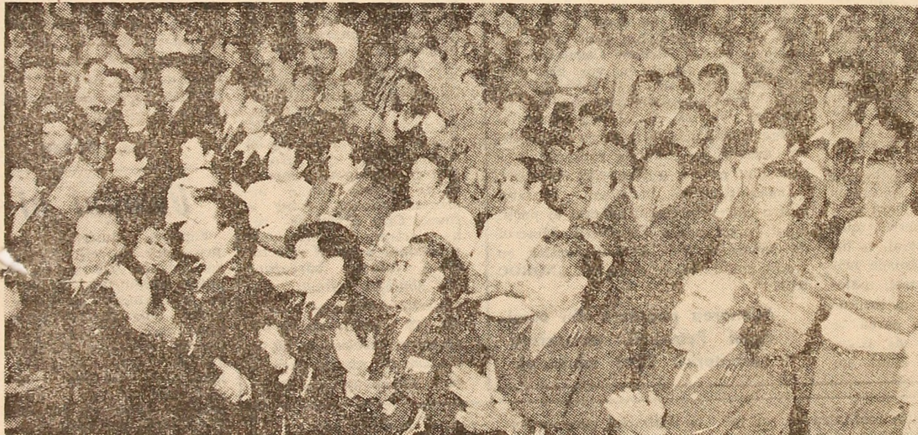
Aspect din timpul adunării festive de la Petroșani.