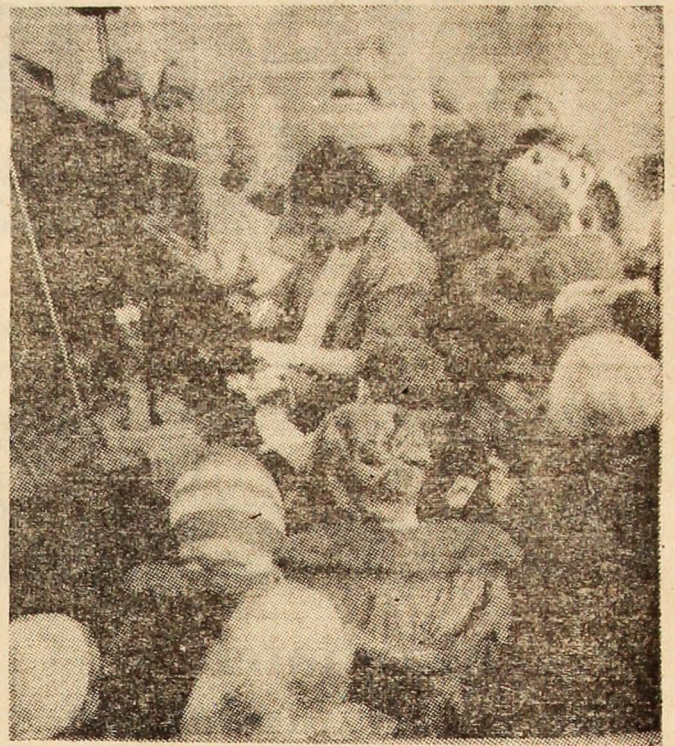
Elevii Școlii generale nr. 1 Petroșani, în vizită la noua tipografie.

Activitățile sportive, care oferă elevilor un atractiv prilej de a se fortifica în atmosfera sănătoasă a muntelui, cuprind competiții îndrăgite: „Olimpiada albă a Văii Jiului” (sanie, la cabana Straja în perioada 24—27 decembrie), „Cupa păcii” (handbal — sala Liceului industrial Petroșani în zilele 22—23 decembrie); șah și tenis de masă, (la Școala generală nr. 1 Petroșani, în 25 decembrie), organizîndu-se și tabere autofinanțate la cabane și stațiuni climatice.