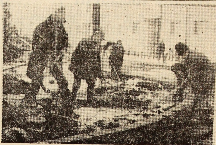
Aspect din timpul efectuării lucrărilor de gospodărie pe Aleea Poporului din Petroșani.

Cît de mult se pot complica lucrurile din cauza unor instalatori, lăcătuși, sudori etc., care, după cum arătau locatarii și cum am putut vedea, atît noi cît și primarul orașului, tovarășul