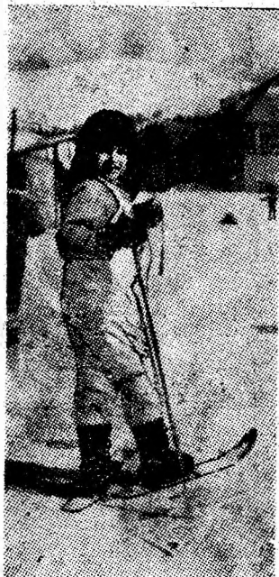
La „Pasu Vilcan”