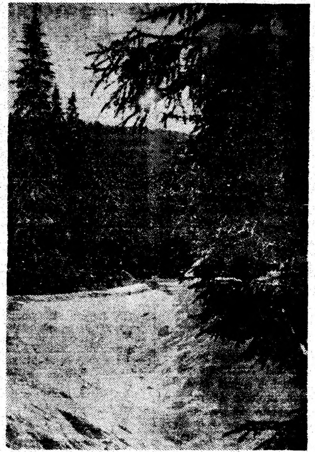
Cîrmepei de iarnă montană.