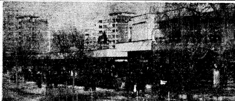
Imagine citadină din tînărul oraș al minerilor — Vulcan.

barea timpului vom concentra la acest loc de muncă mai multe forțe, încît blocul să fie predat la termen. Tot în acest an trebuie să mai terminăm 500 de metri săpături la canalul colector „6 Martie” (restanță de anul trecut) și structura de rezistență la centrala termică automată, care are termen de predare în anul viitor. Noi, cei care avem în primire aceste lucrări ne angajăm să le executăm la termenele prevăzute, să ne onorăm și în acest an obligațiile față de viitorii locatari ai apartamentelor. Interlocutorul ne asigură că dispun de utilajele necesare pe șantier (două macarale, un buldozer și un excavator), iar în ceea ce privește materialele, soliditate sprijinul consiliului popular al orașului Petrița și al conducerii grupului din Petroșani al T.C.H. astfel încît să poată preda la termen și chiar mai devreme apartamentele și obiectivele pe care le au de executat în acest an.