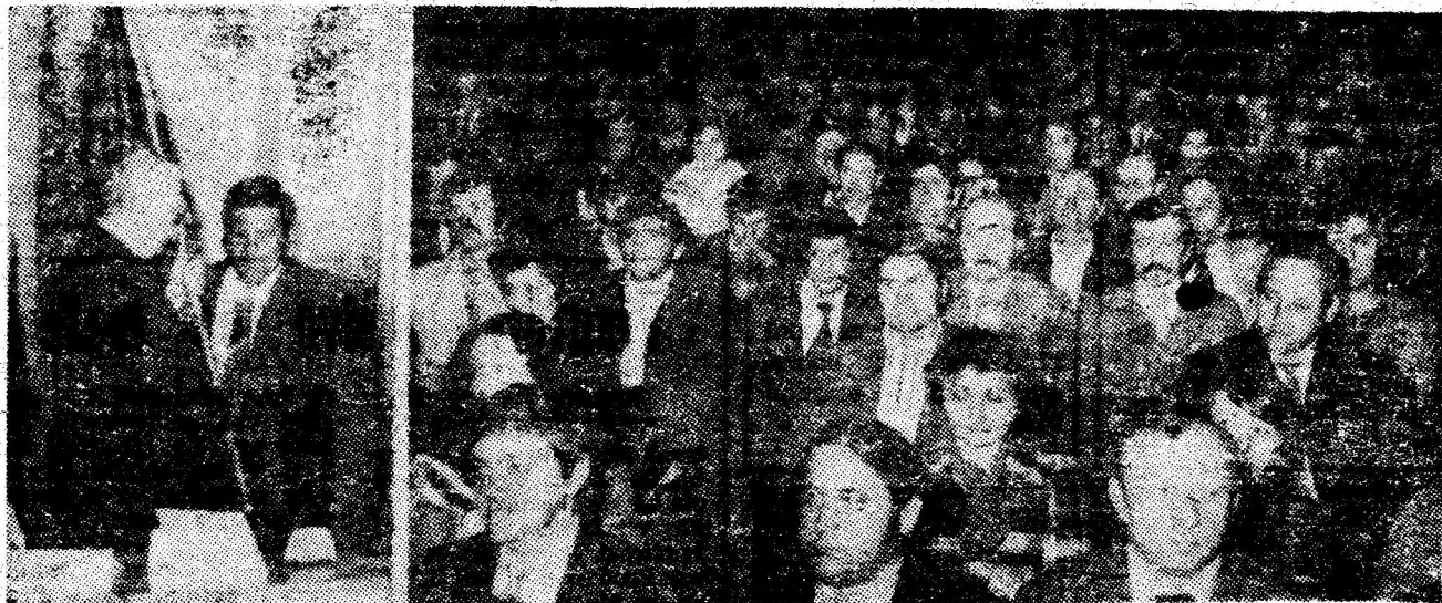
Aspecte din timpul festivității.