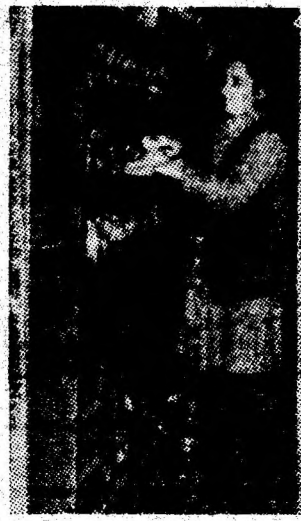
Ordine desăvîrșită la lămpăria I. M. Vulcan.

Desfășurarea înscrierii în clasa a IX-a (treapta I) de liceu va avea loc în iunie (16-25 iunie - înscrierea la secretariatele liceelor și efectuarea controlului medical; 2-4 iulie susținerea probelor de verificare a cunoștințelor; 6 iulie - afișarea rezultatelor).