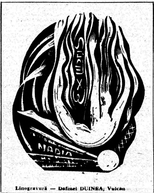
Linogravură — Dafinei DUINEA, Vulcan