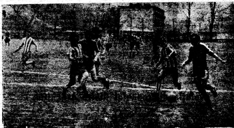
Trecînd de tot ce i-a ieșit în cale, Dozsa, extrema stîngă a gazdelor, șutează puternic în colțul lung al porții oaspete și deschide scorul.