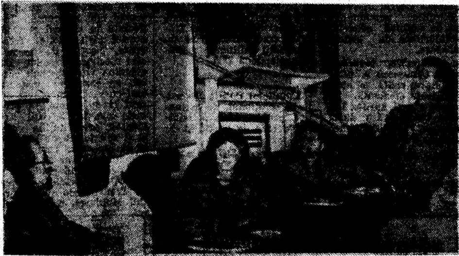
La Paroșeni — un dialog viu, la obiect pe tema inițiativelor muncitorești.

Un alt grup de participanți, reprezentând șantierele T.C.H. constructorii I.C.S. Hunedoara, Șantierul 5 Orăștie, șantierul Riu Mare — Retezat — au vizionat propaganda vizuală la I.C.M.M. În șantierul 1 Petrila al I.C.M.M. s-a putut vedea o propagandă vizuală la obiect și cu fantazie realizată, ancorată în aplicarea inițiativelor muncitorești. În problemele de muncă ce-i frământă pe constructorii și montori. Concret: alături de grafice și panouri ce reflectă stadiile fizice avansate de execuție a obiectivului de investiții — noua secție spălare — flotare a preparației din Petrila — sint afixate obiectivele și rezultatele inițiativei „Simbăta gospodarului” aplicată de 14 echipe de constructori, în timp ce gazeta de perete din incinta șantierului reflectă efectele concrete ale aplicării inițiativei „Judecata muncitorească”. În trimestrul I 1982, când absențele nemotivate au scăzut de la 17 la numai 5 în prezent.