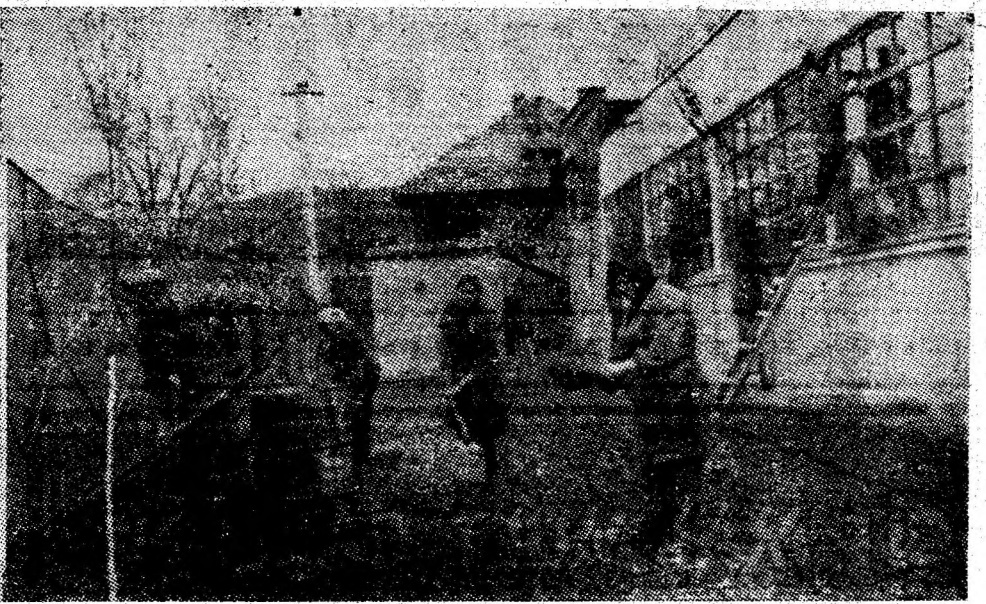
Secția de mobilă Livezeni. Imagine din timpul unei acțiuni de amenajare a incintei.

Cojocaru a vrut să spună ceva, moșul ăsta mîndru nu l-a lăsat, cîcă nu-i plac vorbele mari. În numai patru luni, dovedea că a muncit exemplar, tinărul minier s-a