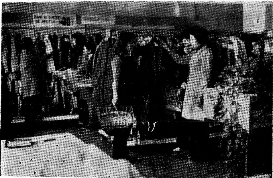
Aspect din cadrul magazinului de confecții situat în noul cartier Bucura din Uricani.