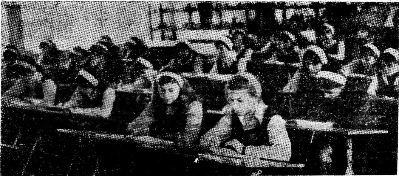
Oră în modernul cabinet de desen tehnic de la Liceul industrial minier din Petroșani.

că pentru gospodărirea și înfrumusețarea orașului, strângerea și valorificarea materialelor reutilizabile; „Minte sănătoasă în corp sănătos” — competiții sportive) care, prin diversitatea lor și sporitul grad de atracție au antrenat un mare număr de elevi. Această manifestare a sintetizat, în forme organizatorice apropiate de copil, conștanțele preocupări de a spori calitatea și eficiența muncii de educație a tinerei generații prin inițierea unor activități legate de viața și munca minerilor din Lupeni. A doua ediție a săptămânii „Pionierii, flori de mai” s-a încheiat prin ample activități educative, culturale și sportive la care au participat, la zona de agrement Brăița, mii de pionieri și elevi din Lupeni. (T.S.)