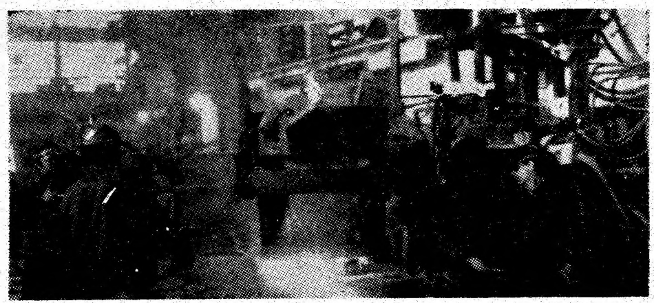
Aspect de la turnătoria de oțel a uzinei.