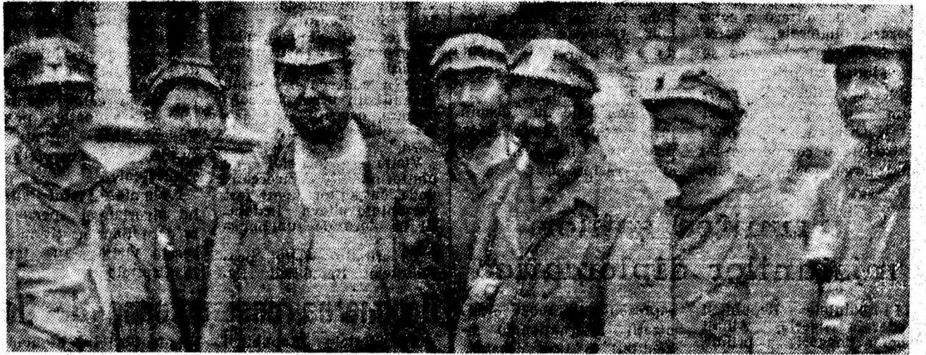
Brigada Ion Buduliceanu, sectorul VI, Lu-peni.

Sarcinile stabilite prin preliminar, pentru acest an la I.M. Lupeni prevăd că se vor extrage din abataje dotate cu complexe mecanizate de susținere peste 1,3 milioane tone de cărbune cocsificabil. Nivelul planificat al productivității muncii în astfel de abataje se situează, de asemenea, la o cotă de vîrf în Valea Jiului, cu o medie de circa 10 tone/post. În patru din sectoarele productive ale minei — IV (sectorul cu cea mai mare producție zilnică din Vale — 2000 tone/zi), VI, III și VII — producția de cărbune cocsificabil se extrage, aproape fără excepție, din abataje dotate cu complexe mecanizate, iar în lucrările de pregătire ale sectoarelor respective funcționează combinate de înaintare care asigură mecanizarea tăierii. Transportul în abataje și pe gările aferente marilor capacități productive ale minei este, de asemenea, mecanizat. Iată, deci un sumum de condiții tehnico-organizatorice, de structuri ale producției care angajează în fața colectivului I.M. Lupeni exigențe deosebite, răspundere muncitorească la cele mai înalte cote, în vederea creșterii producției de cărbune cocsificabil.