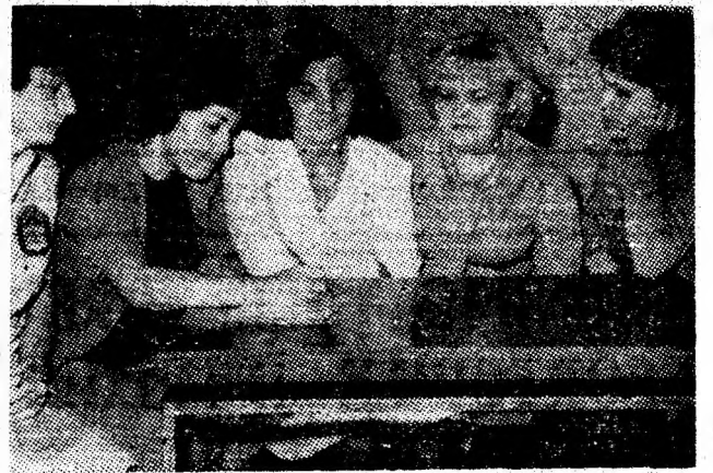
Echipajul întreprinderii miniere Dilja, cel care a ocupat locul I în concurs.

Integrată în cadrul acțiunilor prilejuite de Săptămîna Crucii Roșii, zilele trecute a avut loc, în sala mică a Casei de cultură a sindicatelor din Petroșani, faza municipală a concursului „Cine știe, cîștigă” pe teme de educație sanitară. Au participat echipajele componente ale grupelor sanitare de Cruce Roșii, clasate pe primele locuri la faza pe localități a concursului după cum urmează: echipajul I.M. Uricani, „Viscoza” Lupeni, I.M. Paroșeni, I.M. Lonea, I.M. Dilja și I.M. Aninoasa.