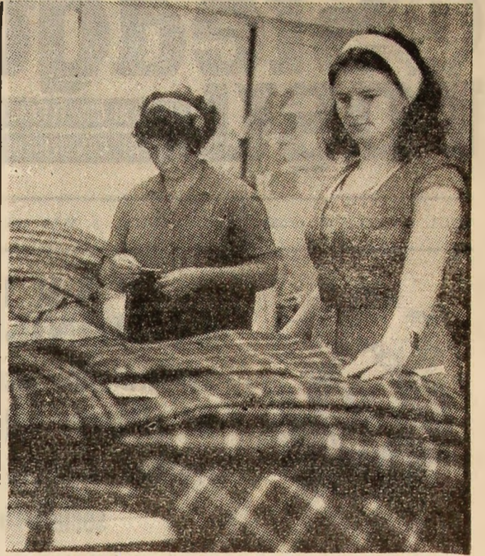
Tinărul colectiv al Întreprinderii de confecții Vulcan, întregul personal al întreprinderii este profund recunoscător secretarului general al partidului, tovarășul Nicolae Ceaușescu, la al cărui indicății a fost construită I.C. Vulcan.

„Poporul nostru — aprecia tovarășul Nicolae Ceaușescu — care a fost exploatat și asuprit vreme îndelungată, care a trebuit să ducă lupte grele pentru cucerirea independenței și suveranității naționale, a libertății, este astăzi deplin stăpîn pe soarta sa, pe bogățiile naționale și pe munca lui, făurindu-și în mod liber o viață nouă, prosperă”.