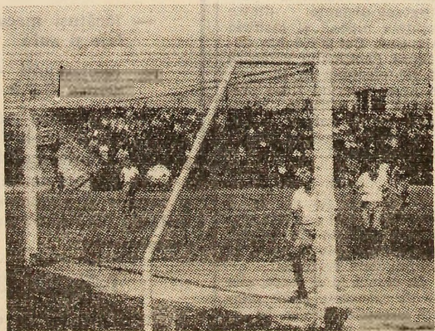
Fază de gol din meciul Minerul Paroseni — Metalul Aiud.