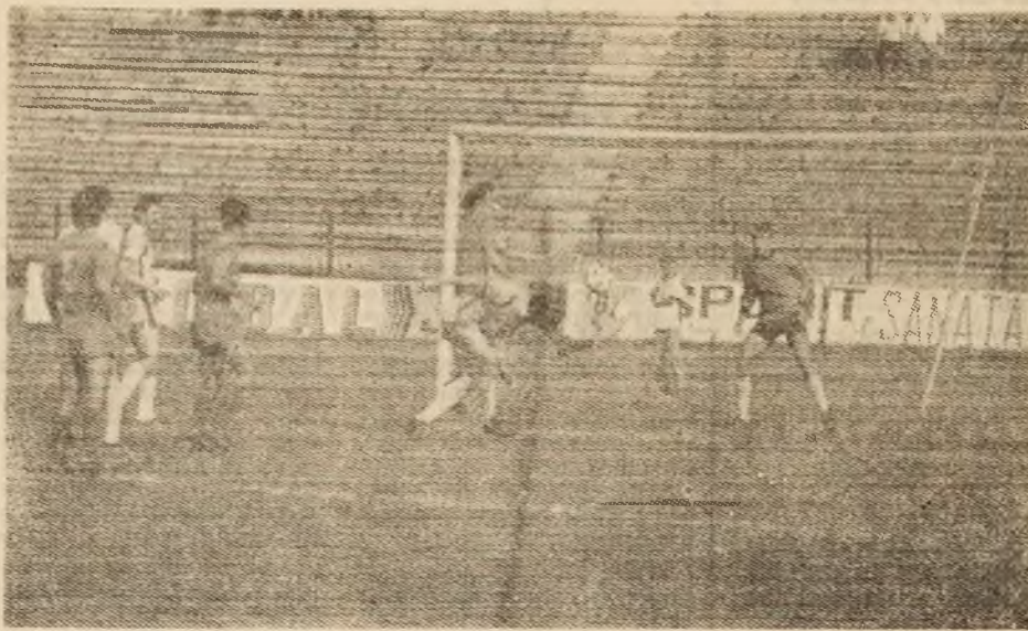
...și mingea scutură plasa porții brașovene.