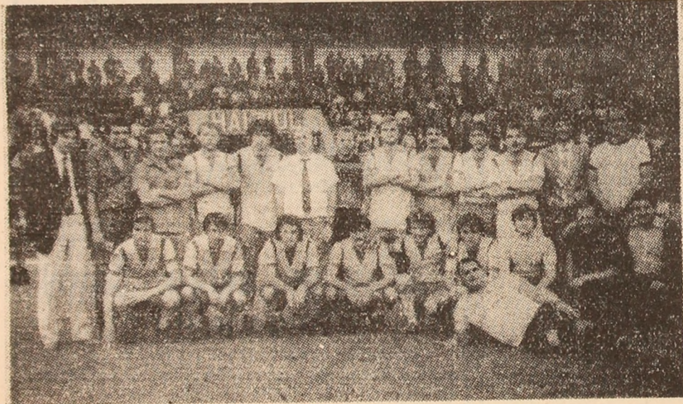
Fotbaliștii Jiului surid în fața obiectivului foto. După atleata emoții, vorba marelui Will: „totul e bine, cînd se sfîrșește cu bine”.