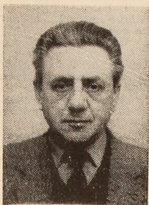
de ce nu — publicul spectator, acest al „12”-lea jucător...

— Fotbalul românesc se află într-un moment de binemeritate vacanță. Vă cerem părerea asupra modului de abordare al viitorului sezon fotbalistic de către jucători, antrenori și —