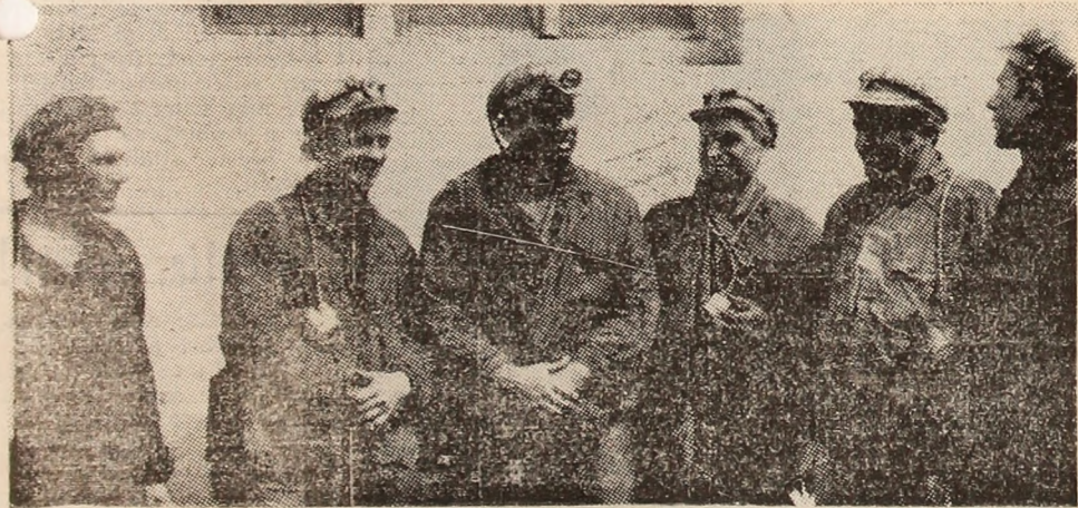
Revenim la întreprinderea minieră Aninoasa