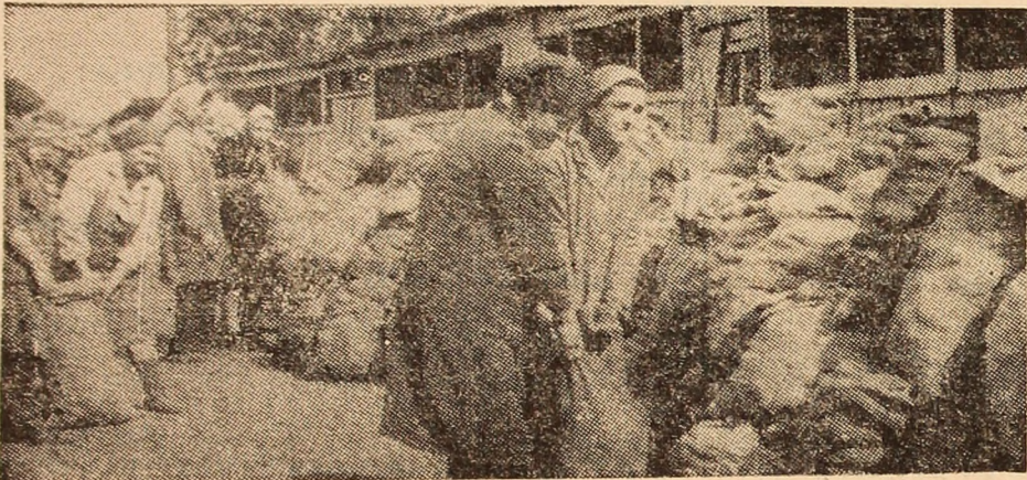
Activitate febrilă la depozitul nr. 2 Lupeni al C.P.V.I.L.F.

Spațiile de depozitare pentru anotimpul rece