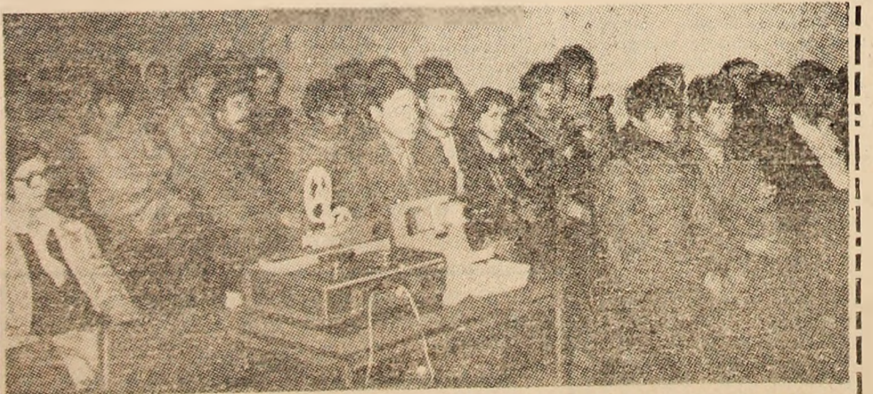
Instantaneu din timpul desfășurării simpozionului aniversar „15 ani de activitate speologică organizată în Valea Jiului”.

plul dialog pe teme speologice a avut ca epilog festivitatea de premiere, cu care prilej au fost înmîinate diplome și trofee celor mai valoroase cercuri și speologilor evidențiați în activitatea de popularizare, prin artă și în teren, a mirificelor zone carstice din Valea Jiului, din întreaga țară. Din partea ziarului nostru a fost înmînat un trofeu jubiliar cercului speologic sărbătorit. (I.V.)