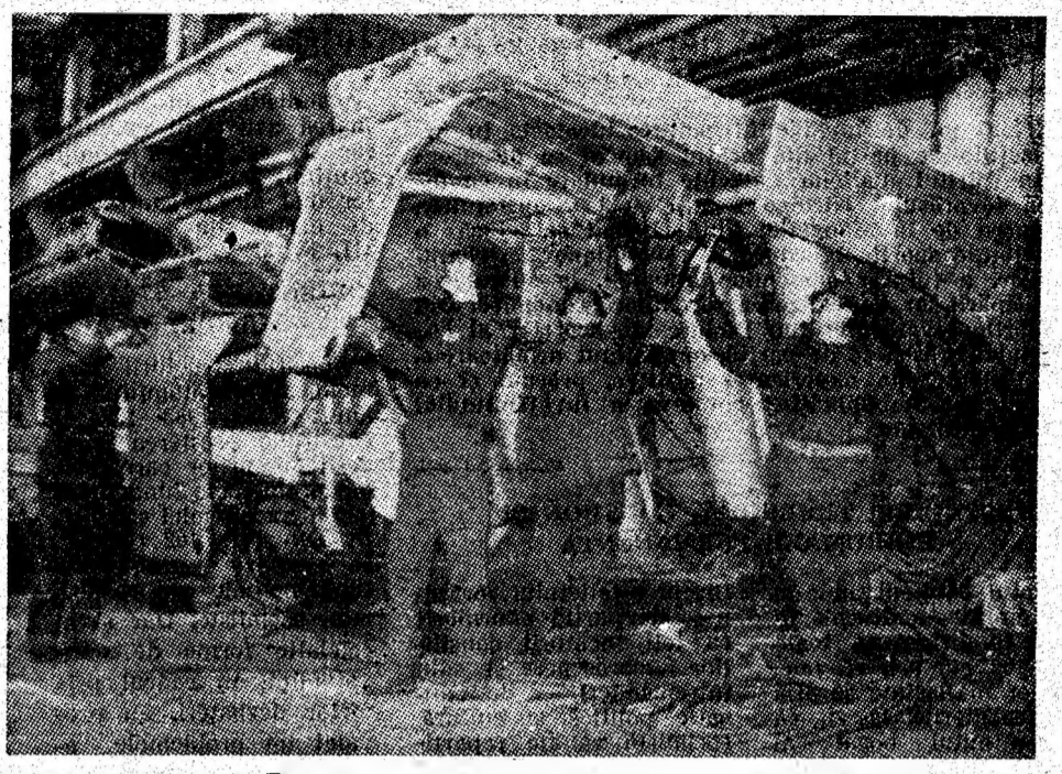
Susținerile mecanizate de tipul SMA.2 — „produsele finite“ în producția de serie a I.U.M. Petroșani. În imagine, definitivarea montării unor astfel de susțineri mecanizate.

La invitația tovarășului Nicolae Ceaușescu, președintele Republicii Socialiste România, primul ministru al Canadei, Pierre Elliott Trudeau, va face o vizită oficială în România la începutul lunii februarie a.c.