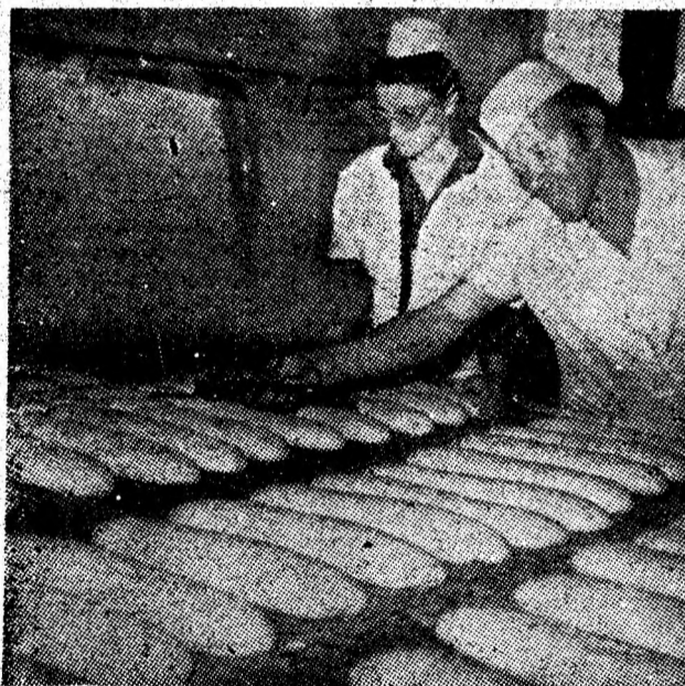
Aspect de muncă din cadrul noii fabricii de piine din orașul Lupeni.

tele pentru porci sau iepuri de casă, sobe metalice uzate, bucăți de beton și alte asemenea reziduuri din gospodărie, a căror transportare nu cade în sarcina