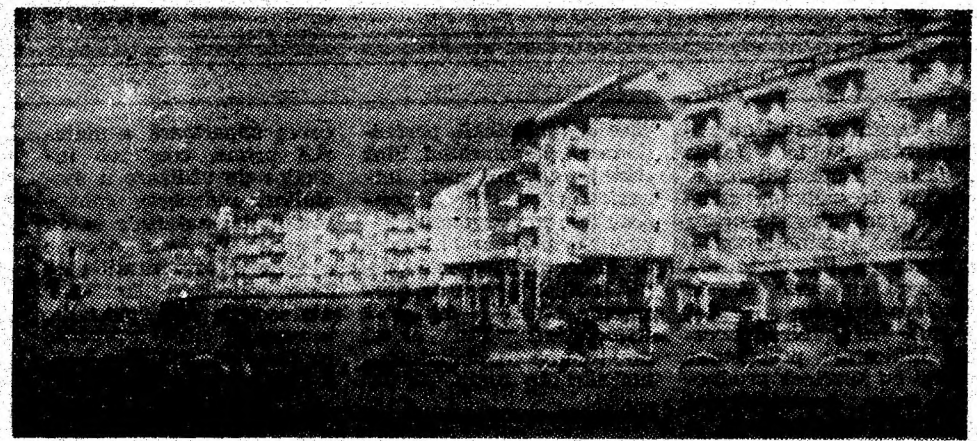
Conturul urbanisticii moderne in noul cartier Petrosani Nord.

ANUL XL, NR. 9806 | MIERCURI, 21 MARTIE 1984 | 4 PAG. - 50 BANI