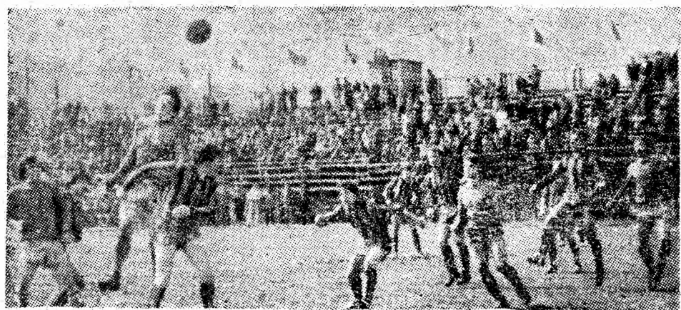
Fază din meciul „Minerul” Paroșeni — „Metalul” Oțelul Roșu.