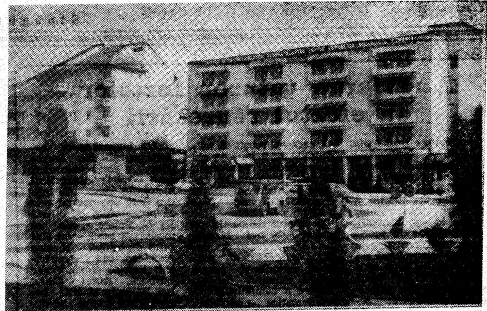
Frumoasă zi de primăvară în Petroșani.