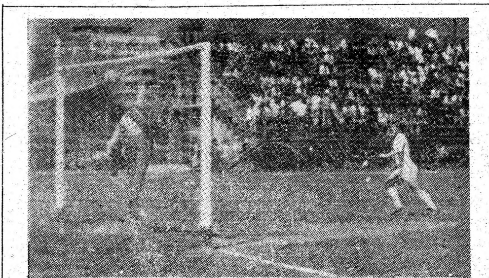
Minutul 10 al partidei de la Vulcan: de pe extrema stîngă, Bilieru reconfirmă, înscriind un gol de toată frumusețea. Opoziția lui Crecan este zadarnică și oaspeții conduc în derby-ul minerilor din Vulcan, 0—1.