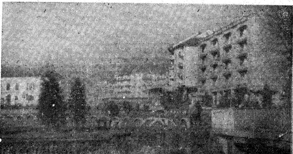
Imagine citadină din zona noului cartier Petroșani-Nord, aflat într-un amplu și continuu proces de modernizare.

Un nume de stradă, Horia, și o cifră, 128, desprinse din activitatea înnoitoare, deosebit de amplă cunoscută de municipiul nostru în această perioadă, ne-au îndemnat să inserăm rîndurile de față. Un nume evocat cu admirație și respect, ale cărui ecouri sînt și se cuvîne să fie în continuare amplificate prin noi fapte și momente memorabile, realizate în epoca inaugurată de fierbintele August 1944. În strada ce poartă numele marelui martir al luptei împotriva asuprii naționale și sociale, supusă unor înnoiri deosebite, ca de altfel întreg municipiul nostru, constructorii au înălțat în partea de Nord a