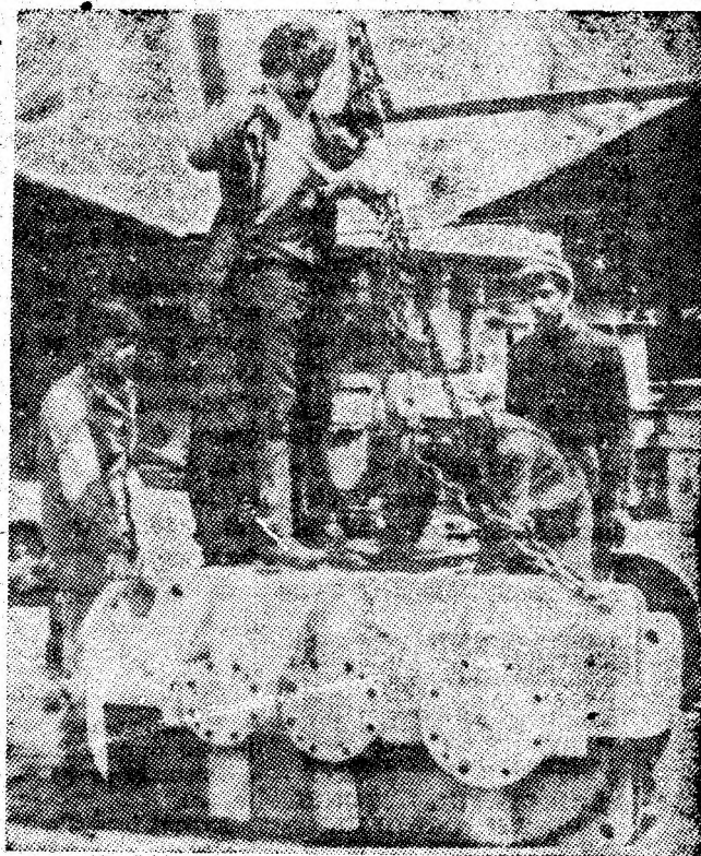
Cit primești, cit dai societății