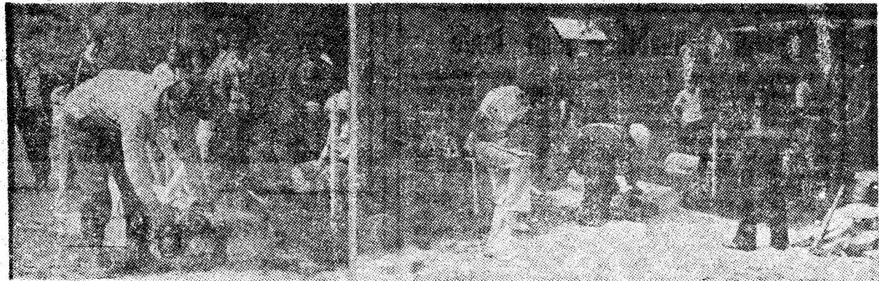
Cei mai buni, cei mai vrednici fasonatori mecanici din sectoarele forestiere ale județului în concurs — o adevărată demonstrație „contra cronometru” a măiestriei profesionale.

În cadrul festivității de premiere ce a urmat după deliberarea juriului, primilor trei clasați pe sectoare și pe întreprindere li s-au acordat diplome și premii.