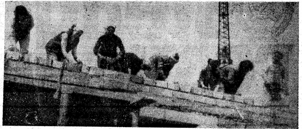
În dreptul Școlii generale nr. 4 din orașul Vulcan, harnicii constructori înalță un modern bloc de locuințe cu 56 de apartamente luminoase și confortabile.