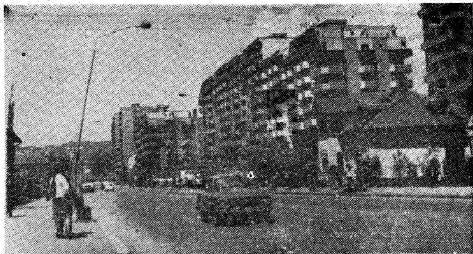
O nouă dovadă a ritmului trepidant al modernizării reședinței de municipiu. In imagine, artera principală a Petroșaniului.