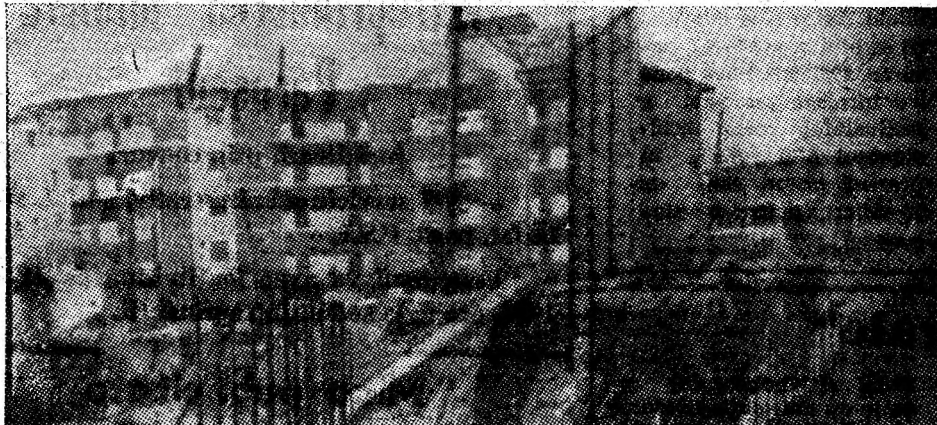
În cartierul Petroșani-Nord prinde contur noul centru civic al reședinței de municipiu.

Orașul Uricani, făurit de constructori va cunoaște în următorii ani o dezvoltare fără precedent.