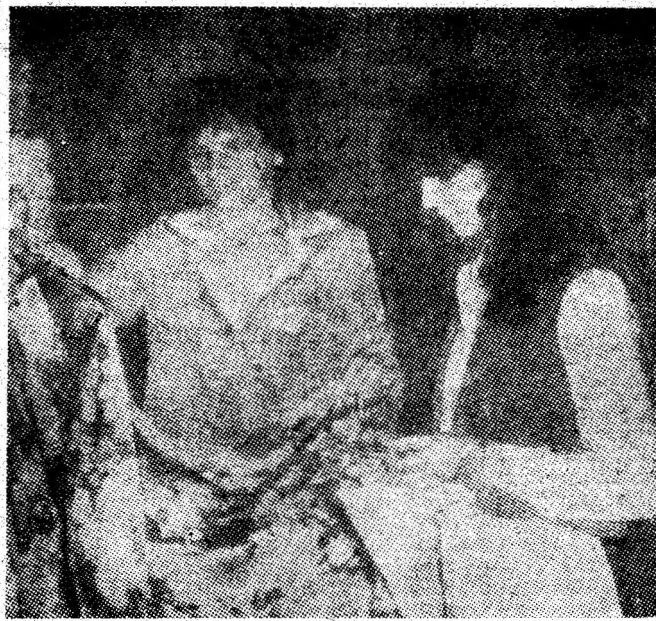
Raionul „confecții pentru femei”, din cadrul magazinului general Petrila, este remarcat pentru calitatea serviriilor cumpărătorilor care găsesc aici o gamă foarte diversă de mărfuri.

Întreaga activitate medico-sanitară din Valea Jiului este orientată de concepția fundamentală despre viață și sănătate, despre vigoarea și tinerețea națiunii, afirmată cu clarviziune de tovarășul Nicolae Ceaușescu, secretarul general al partidului, la Plenara lărgită a Consiliului Sanitar Superior din 7 martie a.c. „Întreaga noastră activitate, sublinia tovarășul Nicolae Ceaușescu, trebuie să aibă permanent în vedere asigurarea unei sănătăți cât mai bune a populației, sporirea natalității, realizarea unei structuri cât mai armonioase de vîrstă a poporului. De aceasta depinde viitorul poporului, însăși fîurirea cu succes a socialismului în patria noastră”. Inșăși dezvoltarea bazei materiale din domeniul sănătății în acești 40 de ani, calitatea și eficiența asistenței acordată de cadre medicale cu temeinică pregătire profesională și moral-politică, sint convingătoare expresii ale grijii permanente pentru sănătatea mamei și copilului, a minerilor, a tuturor ceme-nilor muncii din Valea Jiului.