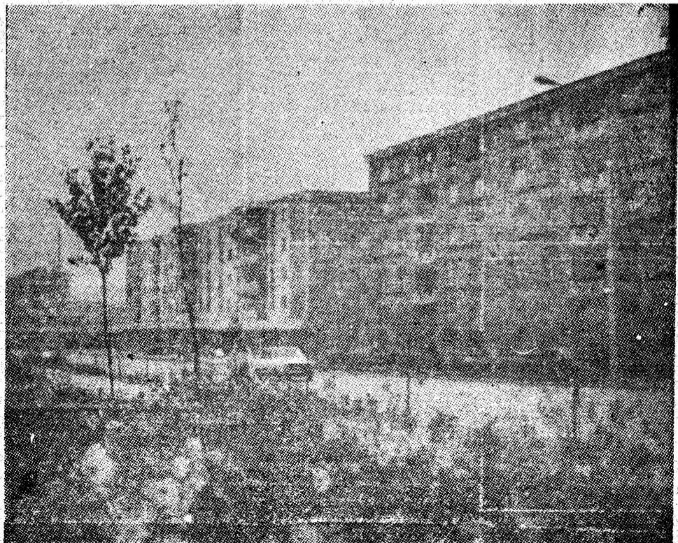
Noua arteră, bulevardul Pacii, care străbate centrul civic al orașului, creație a perioadei pe care o numim cu mindrie „Epoca Ceaușescu”.