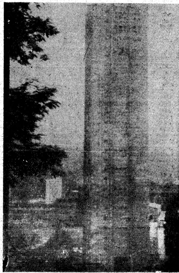
Intruchipare a concepției tehnice îndrăznețe, turnul noului puț cu schipuri de la Lupeni pare un obelisc ce simbolizează ascensiunea neîntreruptă a orașului și oamenilor lui.