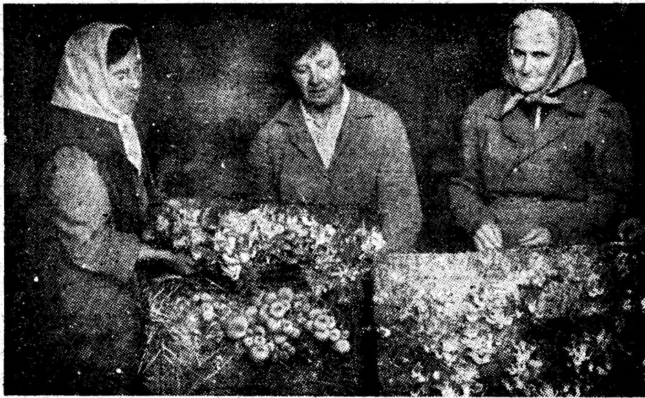
Activitate intensă în ciupercăria proprie a „Centrului de prelucrare și valorificare a fructelor de pădure din Isroni”.