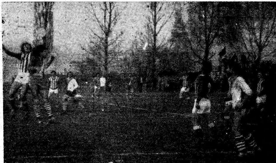
Dispută aprigă pentru balon în derby-ul campionatului județean Minerul Bărbăteni — Preparatorul Petrița.

● RUGBY, „Cupa României”: Chimia Buzău — Știința Petroșani 18—9 și Sportul studențesc — Știința Petroșani 21—6.