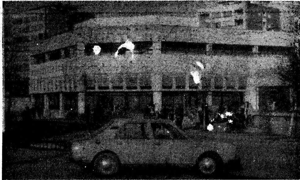
Noua hală agroalimentară, dată recent în folosință, se integrează perfect în peisajul social-economic al orașului Vulcan.

Ioan MARCU, președintele Cooperativei meșteșugărești „Unirea” Petroșani