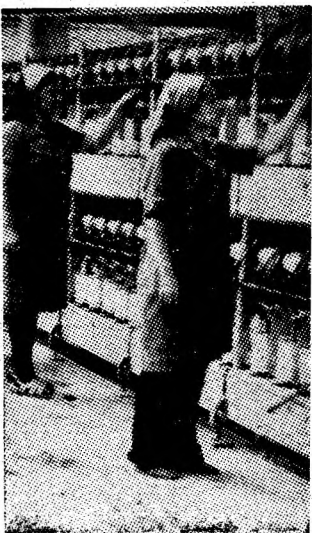
Instantaneu de muncă din cadrul I.F.A. „Viscoza” Lupeni.